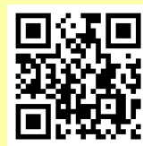
ร่าง พ.ร.บ. การเปลี่ยนแปลง สภาพภูมิอากาศ