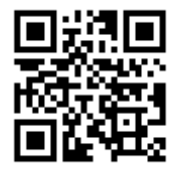
อ่านมุมมองสิทธิฉบับออนไลน์

จัดพิมพ์เผยแพร่โดย สำนักงานคณะกรรมการสิทธิมนุษยชนแห่งชาติ