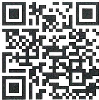
QR Code แบบสอบถามฯ