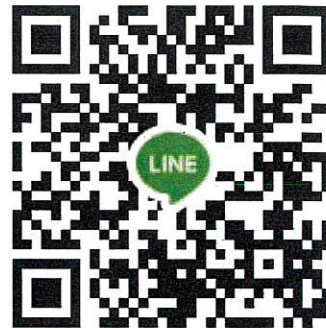
QR Code กลุ่มไลน์เพื่อส่งแบบสอบถามฯ