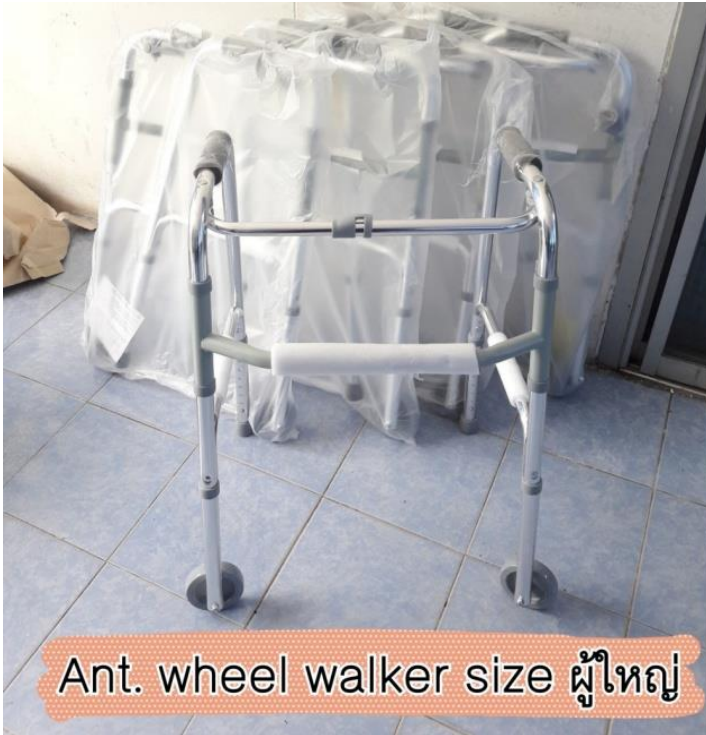
Ant. wheel walker size ผู้ใหญ่