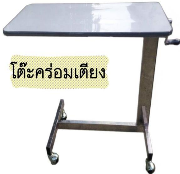
โต๊ะคอมพิวเตอร์