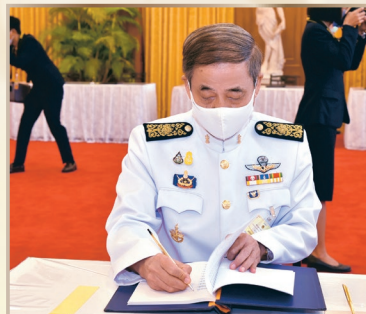
(๒) ลงนามถวายพระพรชัยมงคลและแสดงความจงรักภักดีสำนึกในพระมหากรุณาธิคุณ ณ พระบรมมหาราชวัง