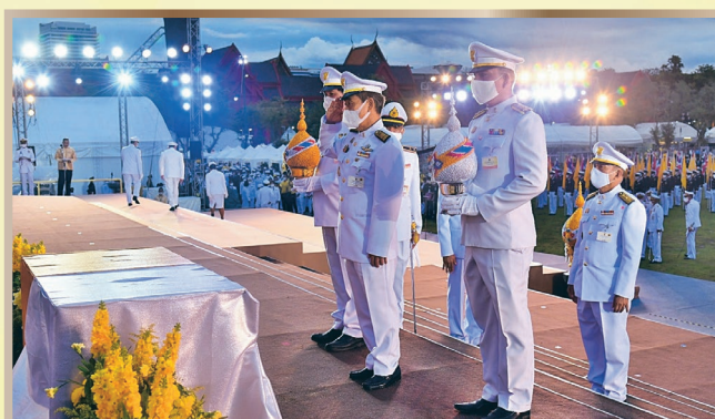
(๔) พิธีถวายเครื่องราชสักการะและวางพานพุ่มและพิธีจุดเทียนถวายพระพรชัยมงคล ณ ท้องสนามหลวง