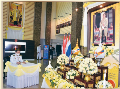
(๓) พิธีถวายสัตย์ปฏิญาณการเป็นข้าราชการที่ดีและพลังของแผ่นดินและลงนามถวายสัตย์ปฏิญาณเพื่อแสดงความจงรักภักดีและสำนึกในพระมหากรุณาธิคุณ ณ สำนักงานศาลรัฐธรรมนูญ ถนนแจ้งวัฒนะ